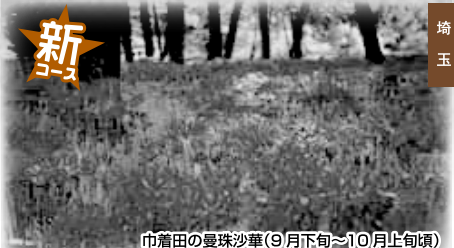
巾着田の曼珠沙華(9月下旬～10月上旬頃)

※各コースの写真はすべてイメージです。 ※例年の情報をもとに設定しておりますが、天候によりお花の見頃がずれる場合がございます。予めご了承ください。