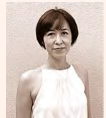
船津丸インストラクター