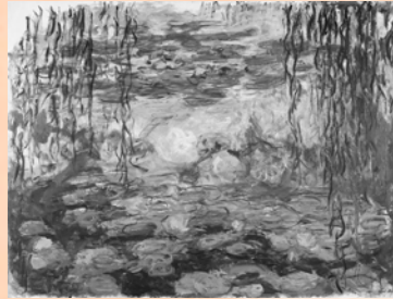
クロード・モネ《睡蓮》 1916-1919年頃 油彩/カンヴァス マルモタン・モネ美術館、パリ